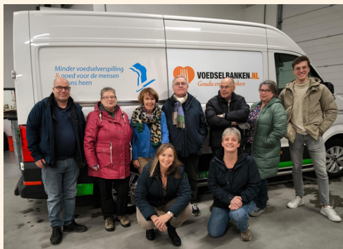
Vrijwilligers van Schuldhulpmaatje bij de voedselbank

We zijn woensdag 20 nov. bij de voedselbank wezen kijken met een aantal vrijwilligers van Schuldhulpmaatje. Dat was heel interessant.